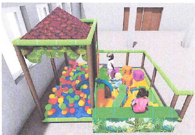
Část interiérového hřiště - pro děti do 4 let