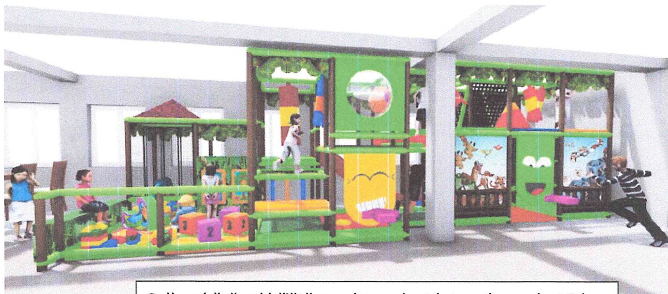
Celkové řešení hřiště se zónou do 4 let a zónou do 12 let